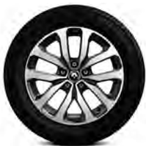
17-Zoll-Leichtmetallrad „Aquila diamantée“